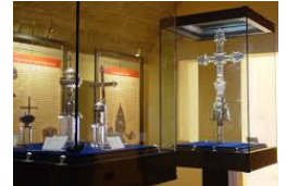
Museo "Scrinia Sacra" - Guasila