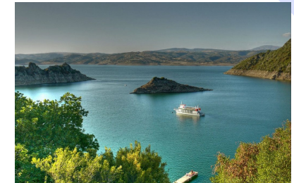
Lago Mulargia -Siurgus Donigala

FORNIAMO MATERIALE E INFORMAZIONI PER LE MANIFESTAZIONI CULTURALI PAESANE E PER LE PRINCIPALI ATTRATTIVE