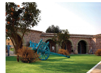
Museo del grano - Ortacesus